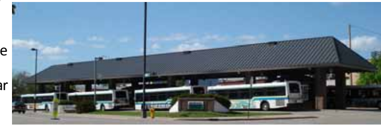
Centro de Transportación de Oshkosh (110 Pearl Avenue) Durante Servicio, las rutas de la Ciudad departen del centro :15 minutos antes de la hora y :45 minutos después de la hora ( con excepción de la Route 10).